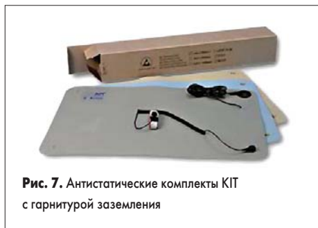
Рис. 7. Антистатические комплекты KIT с гарнитурой заземления

Комбинация высококачественного ESD-стола с неантистатическим офисным стулом встречается на практике так же редко, как и обратная ей; обычно при организации рабочего места соблюдают баланс цен и эксплуатационных характеристик составляющих элементов. В этом плане достойную «пару» обычному стулу с антистатическим чехлом составляет обычный (без проводящего антистатического ламината) монтажный стол, накрытый добротным антистатическим ковриком как минимум в рабочей зоне, а лучше с запасом по площади. Как следует понимать добротность настольного ESD-коврика? Ответ легко найти в конкретном примере: антистатическое двухслойное покрытие (артикул 157) является долговечным, негорючим, выдерживает