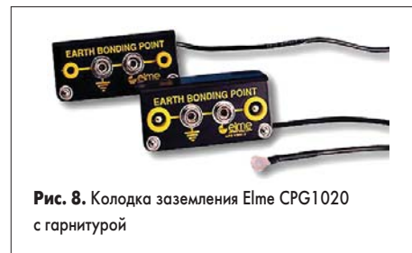
Рис. 8. Колодка заземления Elme CPG1020 с гарнитурой

нагрев до 440 °C (в отличие от уязвимого ESD-ламината стола!), не содержит газовыделяющих галогенов. Верхний слой коврика (антибликовый цветной) рассеивает статическое электричество, а нижний (черный) выполнен из проводящей резины. Время стекания заряда от 5000 до 50 В — менее 0,04 с; значения поверхностного и сквозного сопротивления лежат в пределах 10–100 МОм. Материал поставляется в рулонах шириной 1,22 м для произвольной нарезки или готовыми комплектами (рис. 7) с антистатическим браслетом One-Touch и гарнитурой заземления.