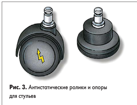
Рис. 3. Антистатические ролики и опоры для стульев

Как было упомянуто выше, статический заряд должен стекать через стул на проводящее покрытие пола и через него на землю. Что делать при отсутствии сплошного покрытия пола антистатическим «линолеумом» с металлической решеткой заземления под ним? Для локальных рабочих зон настоятельно рекомендуется напольный коврик из двухслойного материала 749 DUO (рис. 4) без ПВХ. Верхний износостойкий слой такого коврика рассеивает статический заряд, а нижний (черный) выполнен из проводящей резины, по которой заряд стекает через присоединенный шнур с резистором 1 МОм на землю. Значения поверхностного и проходного сопротивления имеют порядок 10^8 Ом, время стекания заряда (от 1000 до 50 В согласно нормам IEC61340-5-1) составляет не более 0,5 с.