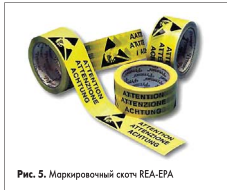
Рис. 5. Маркировочный скотч REA-EPA

Благодаря нижнему проводящему слою под таким ковриком нет нужды прокладывать металлическую решетку и использовать электропроводный клей для плотного контакта с ней, как это требуется в случае с дешевым гомотенным линолеумом. Границы ESD-зоны — в данном случае по краю коврика на полу, — согласно требованиям стандартов ESD должны быть обязательно размечены маркировочным скотчем (рис. 5).