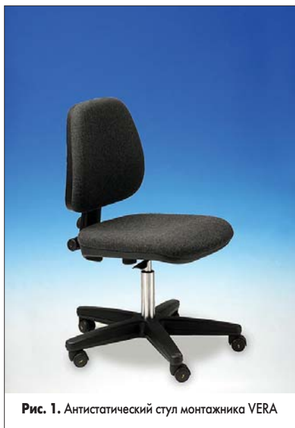
Рис. 1. Антистатический стул монтажника VERA