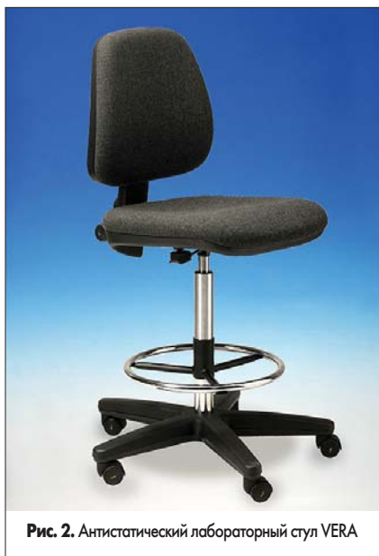
Рис. 2. Антистатический лабораторный стул VERA

Комплекс «ESD-одежда — ESD-стул» относится к вторичным средствам заземления сидящего работника: он рекомендуется к применению совместно с первичными средствами, но не вместо них. Смысл использования вторичного средства наряду с первичным состоит в минимизации статического заряда на теле работника и улучшении условий для своевременного стекания заряда. Антистатическая одежда (халат, брюки) экранирует собой заряд, образующийся на теле при трении нижней одежды; она же служит проводником, благодаря контакту которого с сиденьем и спинкой стула заряд стекает на землю. Очевидно, стул при этом должен обладать особыми свойствами в отличие от своего офисного собрата: он должен быть не великолепным генератором статического заряда, а напротив, высокоомным проводником для стекания заряда на землю.