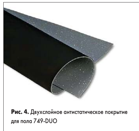
Рис. 4. Двухслойное антистатическое покрытие для пола 749-DUO

Как было упомянуто выше, статический заряд должен стекать через стул на проводящее покрытие пола и через него на землю. Что делать при отсутствии сплошного покрытия пола антистатическим «линолеумом» с металлической решеткой заземления под ним? Для локальных рабочих зон настоятельно рекомендуется напольный коврик из двухслойного материала 749 DUO (рис. 4) без ПВХ. Верхний износостойкий слой такого коврика рассеивает статический заряд, а нижний (черный) выполнен из проводящей резины, по которой заряд стекает через присоединенный шнур с резистором 1 МОм на землю. Значения поверхностного и проходного сопротивления имеют порядок 10^8 Ом, время стекания заряда (от 1000 до 50 В согласно нормам IEC61340-5-1) составляет не более 0,5 с.