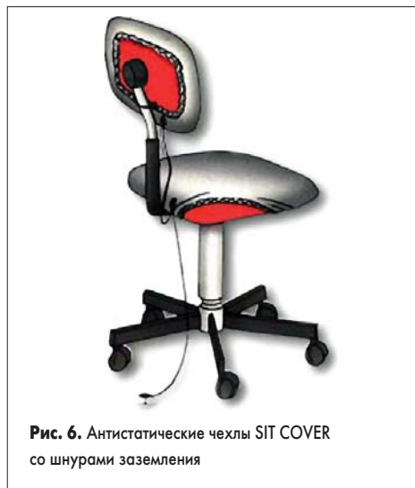
Рис. 6. Антистатические чехлы SIT COVER со шнурами заземления

COVER (кстати, не содержащих никаких металлических составляющих в ткани) полностью соответствуют стандарту IEC61340-5-1 по аналогии с ESD-стульями, а именно: